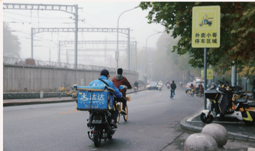
《不延雾》 作者:刘艳红 社区:庆丰社区