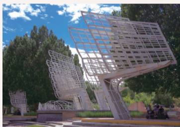
《大通帆涌之夏》 作者:郑跃 社区:九龙社区