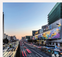
《梦幻世界的双井》 作者:陈静 社区:垂东社区

或许,你眼中的双井,是风花雪月般浪漫、文化娱乐交织的盛宴、人来人往似水流年、商务与科技并进发展、花园城市的惬意悠闲……我们在这里通过有温度、有情感、有深意的影像作品,记录地区自然风光、发展变迁,表现双井人精神风貌,庆祝双井街道建街70周年,为美好点赞、为时代喝彩。让我们共同约定,在光影世界里相遇,用独特的镜头语言,让平凡一瞬变成经典永恒。光影绘卷,感动常在。每一次驻足都是几分欣赏,每一次快门都是怦然心动。哪些作品给你带来了温暖与感动?快为你心目中的佳作投上宝贵一票。