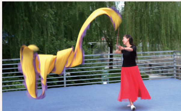
《舞绸》 作者:巩殿武 社区:黄木厂社区