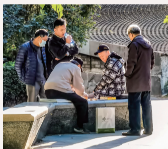
《观战正酣》 作者:杨新亭 社区:九龙社区